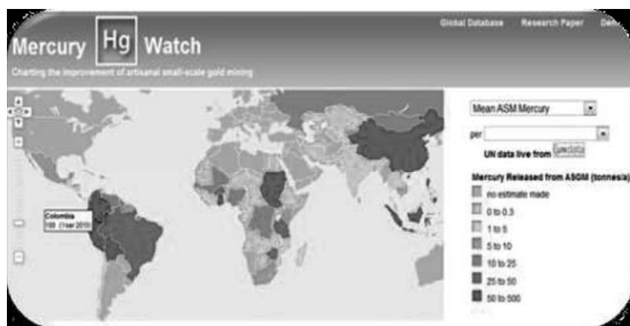
Tabla 1: LIBERACIONES DE MERCURIO POR ASGM

Según Mercurywatch 17 , organización que se dedica a la recolección, análisis y servir públicamente información sobre el mercurio que se libera al ambiente mediante la extracción minera de oro artesanal y en pequeña, Colombia es el segundo país a nivel mundial que más libera mercurio, debido a la minería aurífera artesanal y en pequeña escala (180 toneladas anuales a 2010) después de China (444,5 toneladas anuales a 2010).